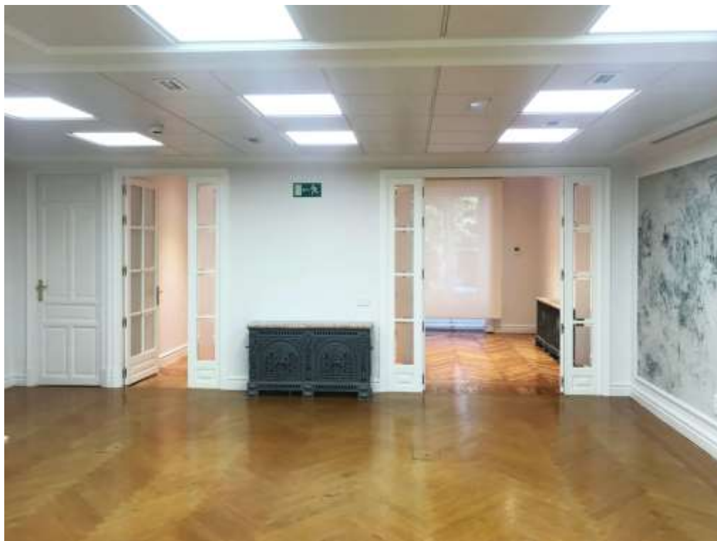
Superficie 242 ms.

Espacios González y Asociados, inmobiliaria de lujo, especializada en zonas exclusivas de Madrid, le ofrece oficina en alquiler en Justicia, Madrid. Se trata de una oficina situada en un edificio clásico, muy representativo, de uso de oficinas, el inmueble tiene 242 ms, actualmente está diáfana, dispone de dos aseos dentro de la oficina, calefacción y aire acondicionado, cableado de fibra, cuarto técnico. El estado es a estrenar la reforma, impecable. Altura libre Zona diáfana: 2,60 m Aseos: 2,30 m Despachos fachada principal: 3,00 m Falso techo Zona diáfana: Falso techo desmontable 60x60. Altura libre 35 cm Aseos: Falso techo desmontable. Altura libre 60cm. Despachos fachada principal: no hay FT. Revestimiento de escayola con molduras.