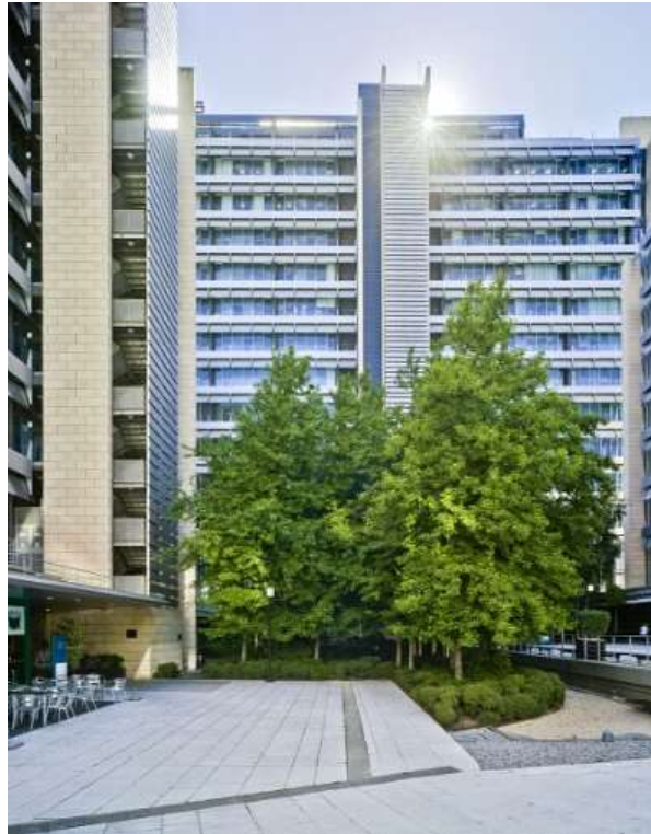
Superficie 213 ms.